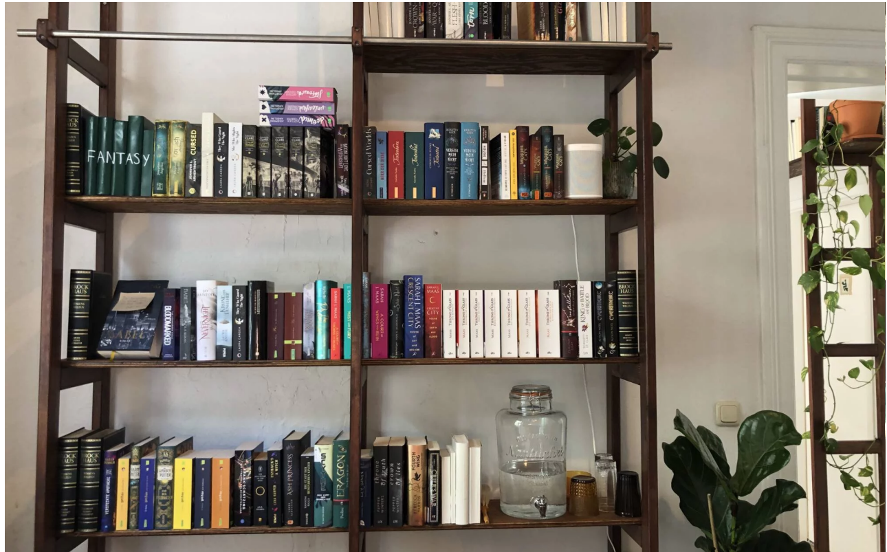
Große Schmökerauswahl